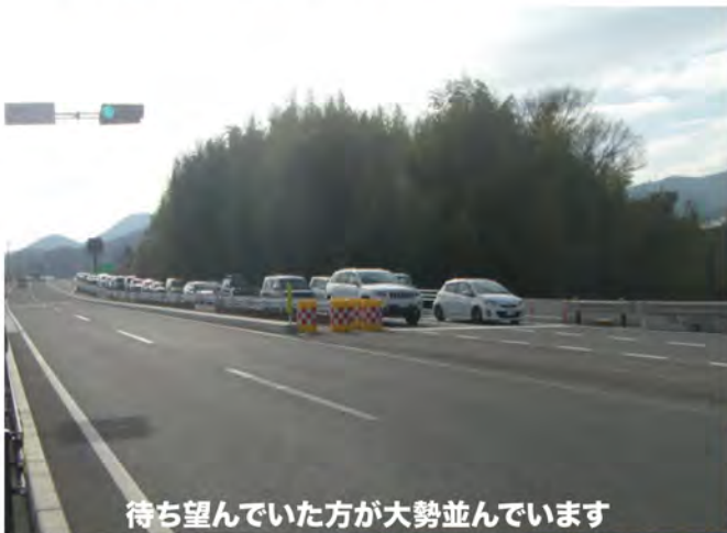
待ち望んでいた方が大勢並んでいます

伊勢原市民が心待ちにしていた伊勢原大山インターチェンジが、ついに開通しました。現在は東京方面へしか行くことが出来ませんが、都心への所要時間が大幅に削減でき、なにより便利になりますね。