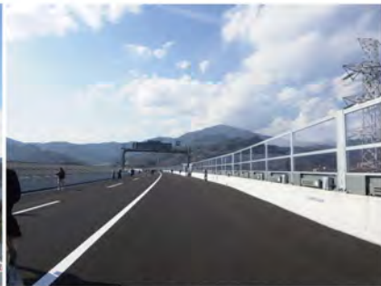
工事関係者の家族で開通前に歩くイベントがありました