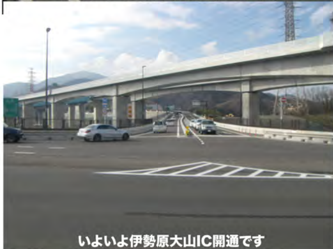
いよいよ伊勢原大山IC開通です